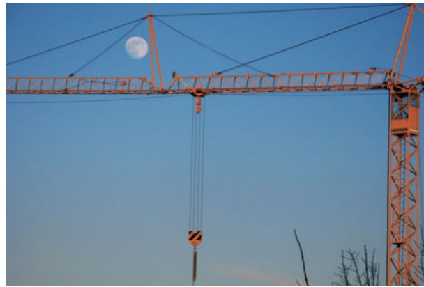
Grúa equipada con engrasadores automáticos BESLUX LUBE

Los fabricantes y usuarios de grúas pueden beneficiarse de importantes ahorros en mantenimiento y recambios utilizando BESLUX LUBE . Su uso reduce el desgaste y la rotura de costosos componentes. La vida útil de los equipos se ve incrementada significativamente mediante la dosificación de la correcta cantidad del necesario lubricante a cada punto. De esta forma instalaciones de muy alto rendimiento se mantienen totalmente funcionales por más tiempo.