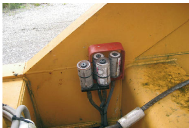
BESLUX LUBE en la lubricación del tambor del cable