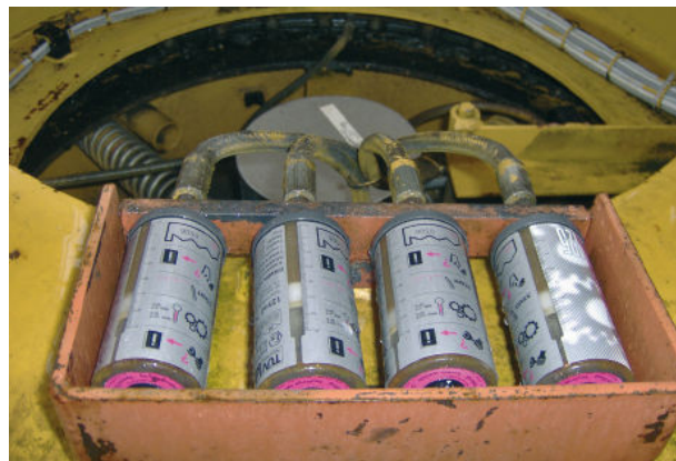
Instalación de los BESLUX LUBE