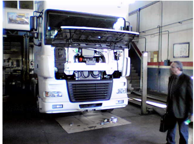
Nuestro jefe de ventas Ramón Cardus inspeccionando un camión nuevo del tipo DAF XF 95-480