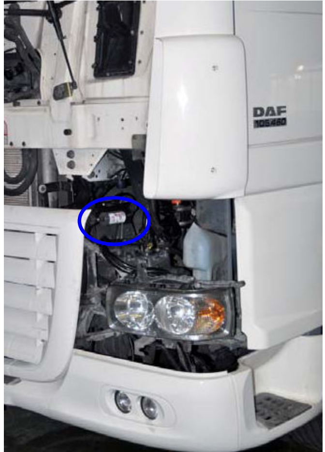
DAF XF 105 con engrasador automático BESLUX LUBE

Por las características del dosificador nunca se supera la cantidad recomendada de grasa en el mecanismo