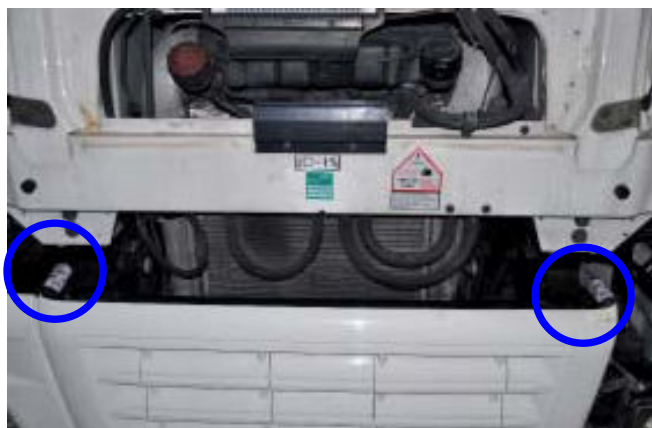
Situación de los engrasadores en la parte frontal del camión