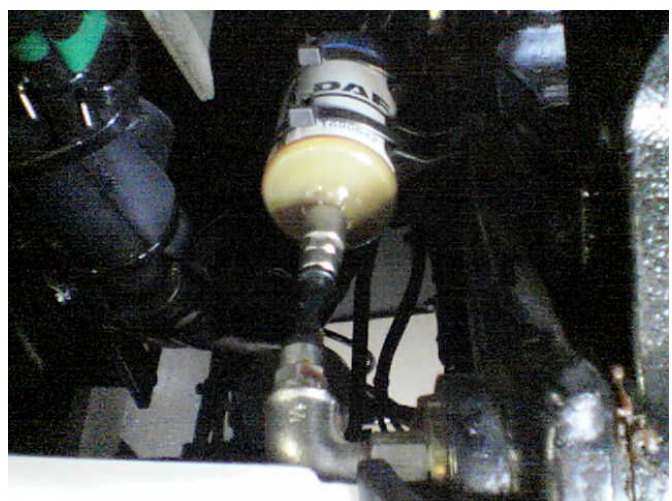
Detalle del engrasador de un DAF XF 95 nuevo (año 2006)